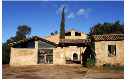
MASIA DE CAN DEU