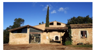
MASIA DE CAN DEU